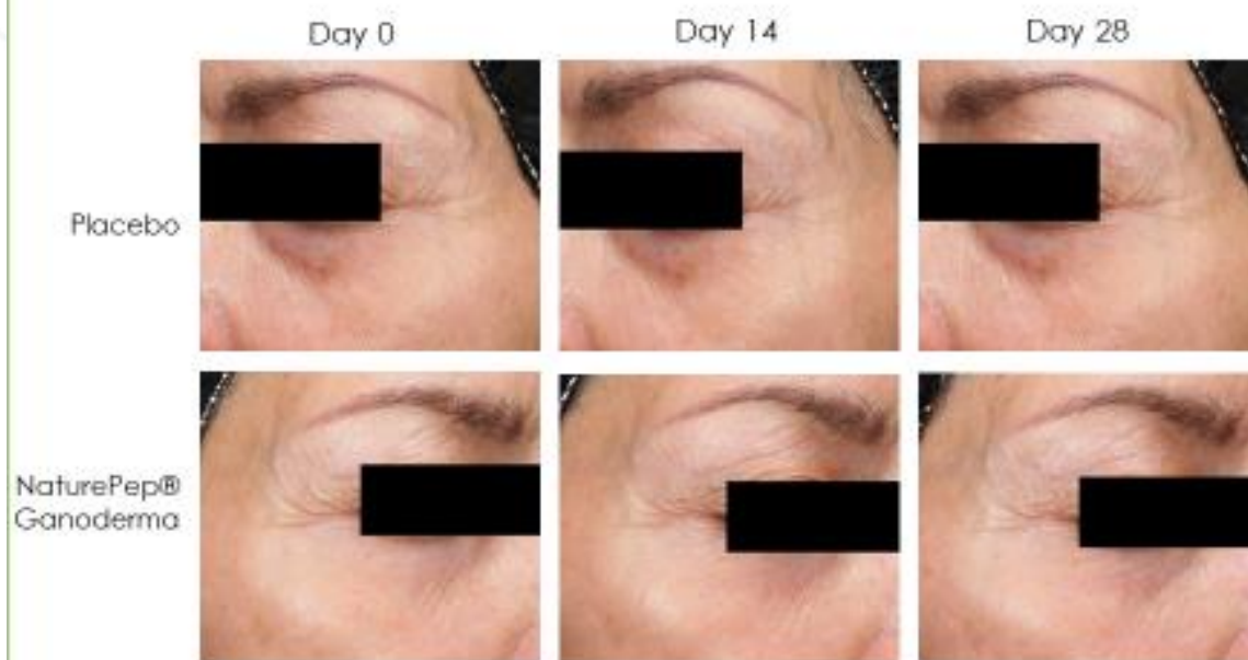
Subject A (Age 67)

Na voluntária abaixo, de 57 anos, podemos ver que além da quantidade das rugas, a profundidade também foi reduzida, com uso de Naturepep Ganoderma